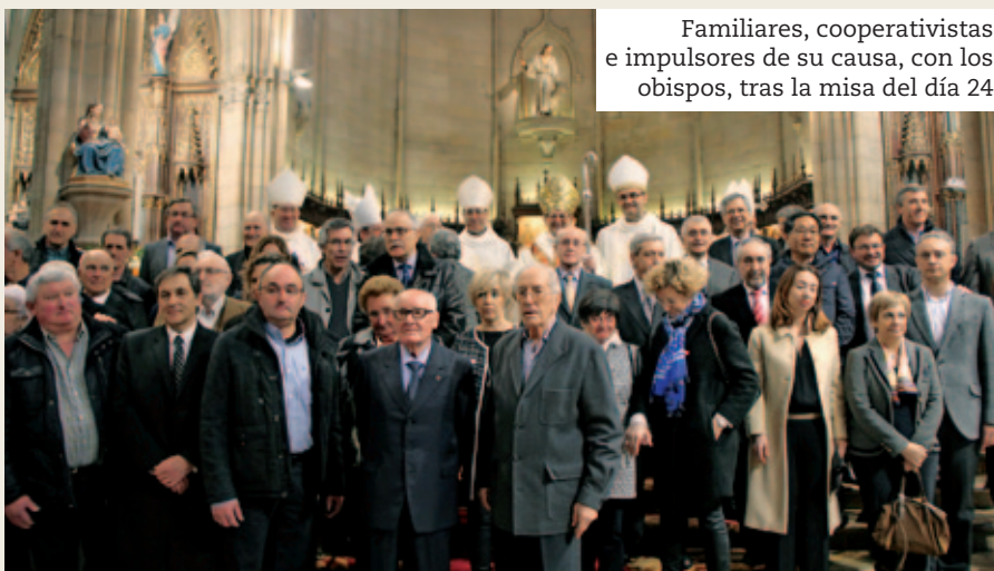
Familiares, cooperativistas e impulsores de su causa, con los obispos, tras la misa del día 24

Que desde su alta atalaya, Arizmendiarieta nos ayude a acertar en la tarea. ¡Que así sea! ●