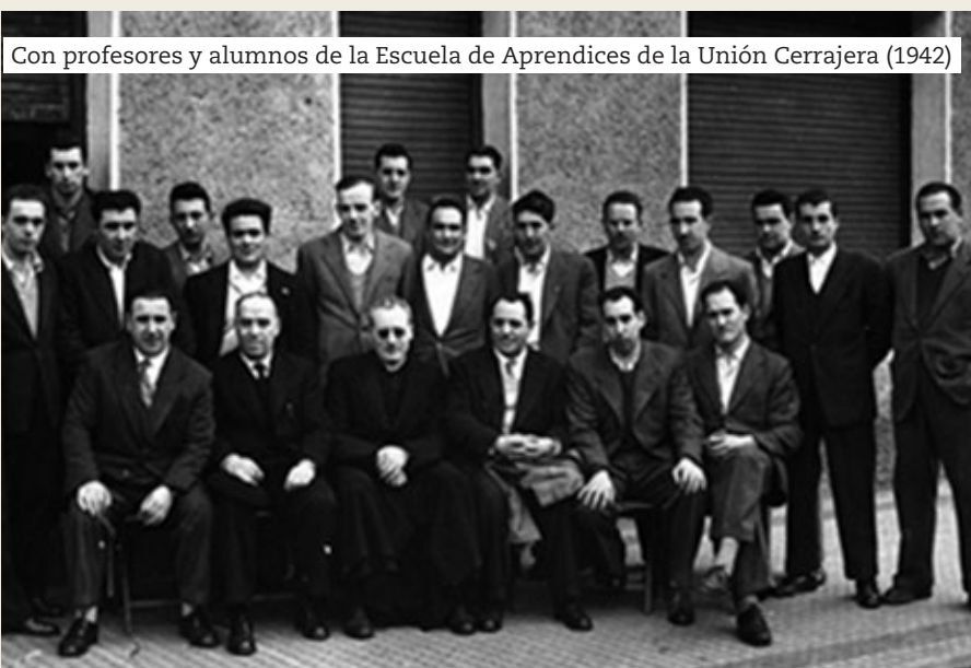
Con profesores y alumnos de la Escuela de Aprendices de la Unión Cerrajera (1942)

El excelente nivel formativo que se imparte en los centros y el espíritu cooperativo e innovador que se vive modifica la escala de valores y genera un caldo de cultivo propicio para el florecimiento de iniciativas de emprendimiento cooperativo.