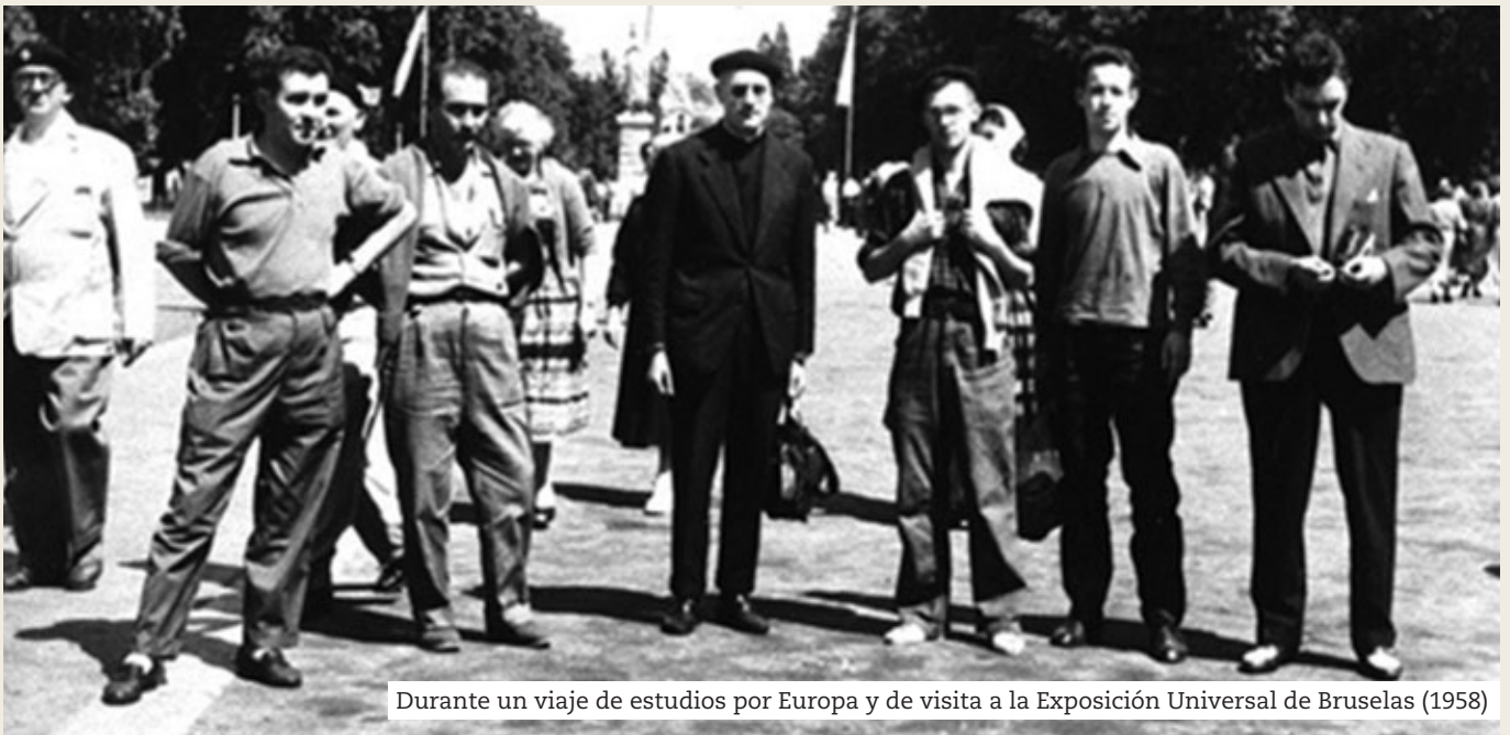
Durante un viaje de estudios por Europa y de visita a la Exposición Universal de Bruselas (1958)

En Arizmendiarieta la correlación entre sentido trascendente y acción immanente es un rasgo esencial. Vivía para Dios, “colaborando con Dios en la tarea de la Creación”, impregnaba de oración su vida y traducía las exigencias de su fe en acciones coherentes al servicio de los demás. Se nutría de la Doctrina Social de la Iglesia, estudiaba a los humanistas más avanzados y sabía interpretar, como pocos, los signos de los tiempos. Trataba a todo tipo de personas: en la calle, en su despacho, siempre abierto a todos, en el confesionario, en sus visitas de trabajo a Madrid, penetraba en los problemas y sentimientos de la gente y tenía palabras de estímulo y aliento, fomentando