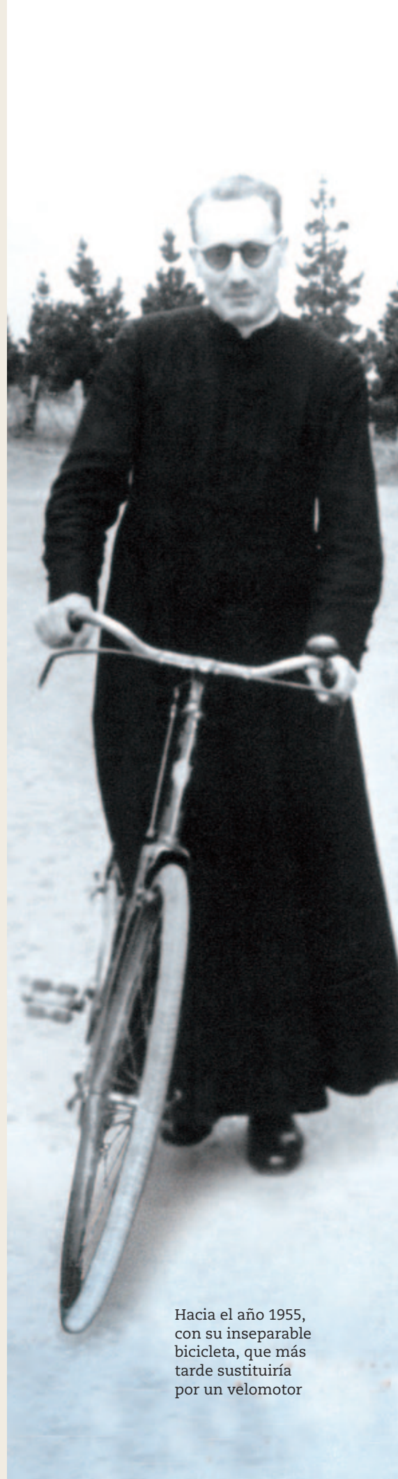
Hacia el año 1955, con su inseparable bicicleta, que más tarde sustituiría por un velomotor

La causa se inicia en el año 2005, culminando su fase diocesana en el año 2009, con el envío del