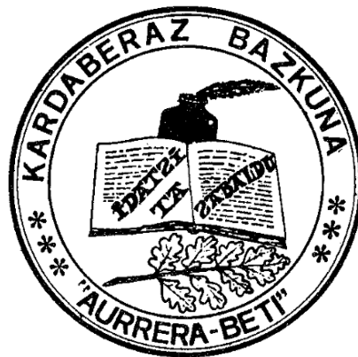
Kardaberaz Bazkunaren zigilua, Arizmendiarietak 1933an egina.

Lehen zenbakiaren gehiena hilberria zen Lizardiri eskaini zioten. Aldizkariaren lema, bigarren zenbakiaz gero, Agustin Kardaberazen beraren euzkerek burua jasotea nai du Jaungoikuak esaldia dugu. Hirugarren zenbakian, Arizmendiarietak berak asmatu eta egindako zigilua azaldu zen, akademiaren arnasa eta taupada zena adierazten duen esaldiarekin: aurrera beti , aurrera etengabe, nekerik gabe, egoera dena delakoa. Eta idatzi ta zabaldu . Euskaraz, ahoz gain, lumaz egin behar zen, hura jakintza arlo guztietan landu zedin.