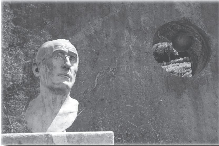
Arizmendiarrietaren omenezko artelanak, Barinagan. Brontzezko burua, Lorenzo Askasibarrek (1980) egina, eta harri, egur eta altzairuzko taldea, Mikel Anjel Lertxundik (1992) egina.

Nire ondoren etorri nahi duenak uko egin biezaio bere buruari, bere gurutzea hartu eta jarrai biezat. Izan ere, bere bizia gorde nahi duenak galdu egingo du; bere bizia niregatik galtzen duenak, ordea, eskuratu egingo du. Zertarako du gizakiak mundu guztia irabaztea, bere bizia galtzen badu? Eta zer eman dezake gizakiak berriro bizia bereganatzeko?